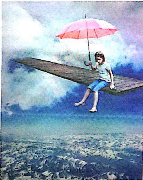
Vertige , de Catherine Rondeau.

Si le titre semble faire directement allusion à Alice au pays des merveilles , c'est qu'elle s'inspire de l'univers des contes, qu'elle a aussi exploré dans un ouvrage intitulé Aux sources du merveilleux , paru en 2011 aux Presses de l'Université du Québec.